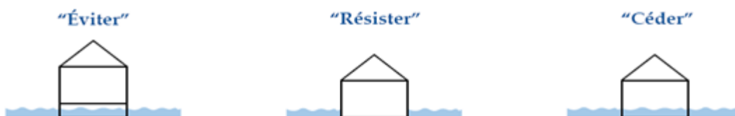
Illustration 3 : Logiques de stratégie de prévention sur le bâti

Pour répondre aux objectifs de prévention des risques sur le bâti, le zonage réglementaire est basé sur différentes stratégies qui sont illustrées ci-dessous :